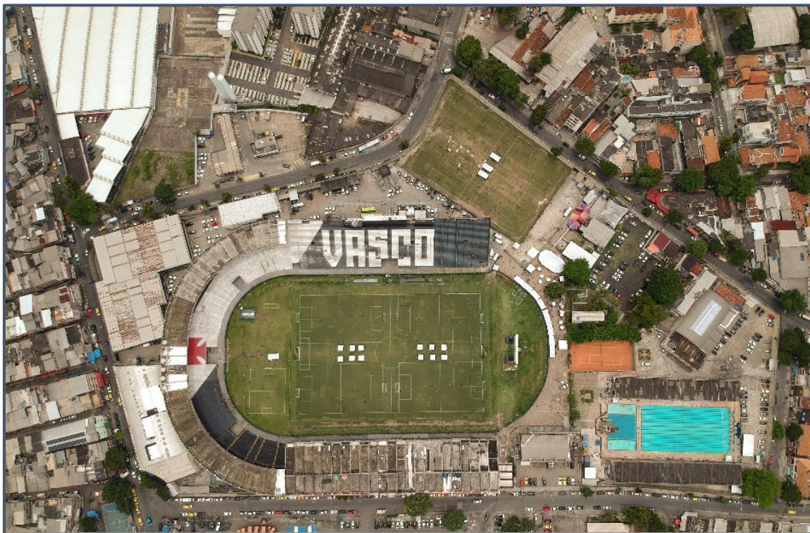
Estádio de São Januário