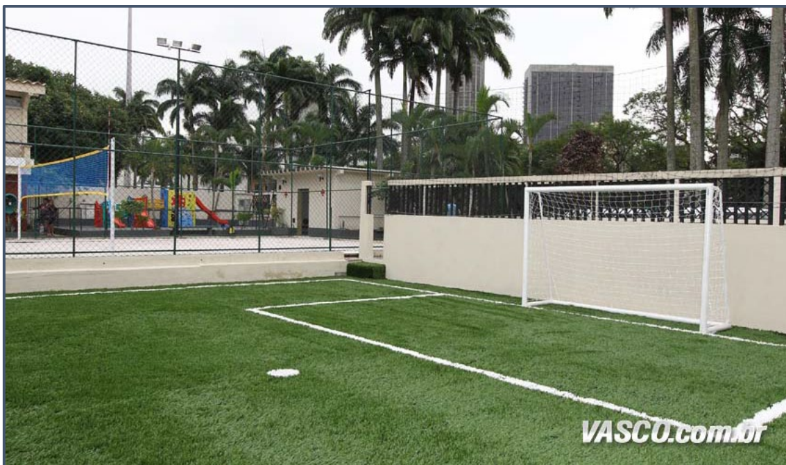
Sede do Calabouço