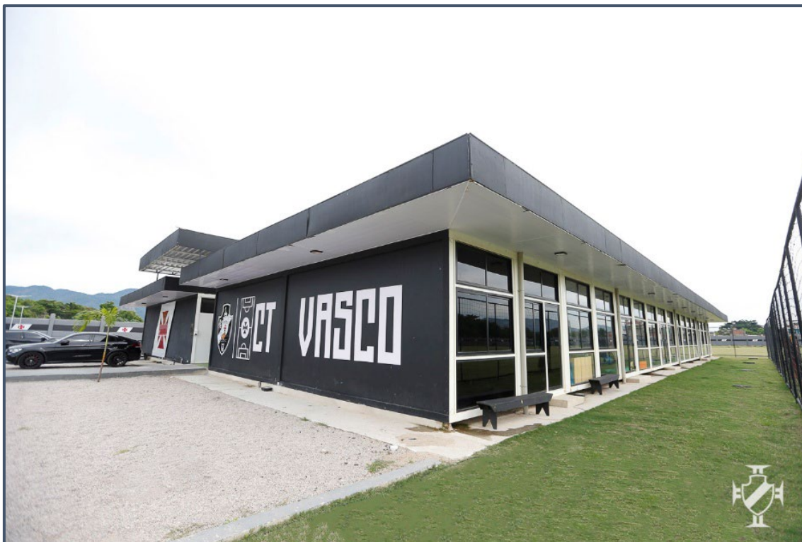
CT Moacyr Barbosa

132. Essas fotografias ilustram as principais instalações das recuperandas, que desempenham um papel fundamental no suporte às suas atividades administrativas e esportivas.