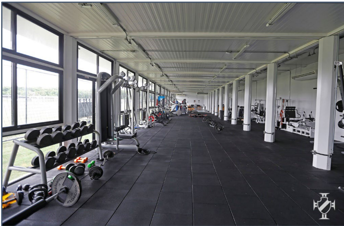
CT Moacyr Barbosa