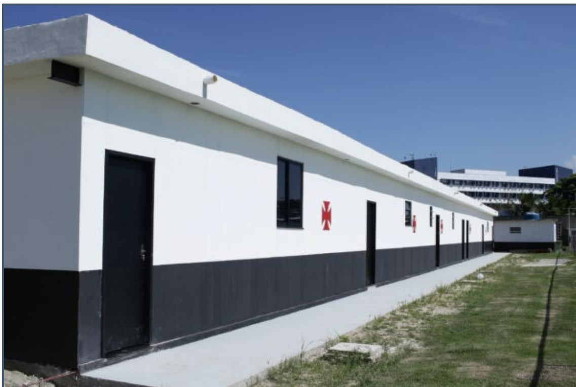
CT Almirante Heleno (Caxias)