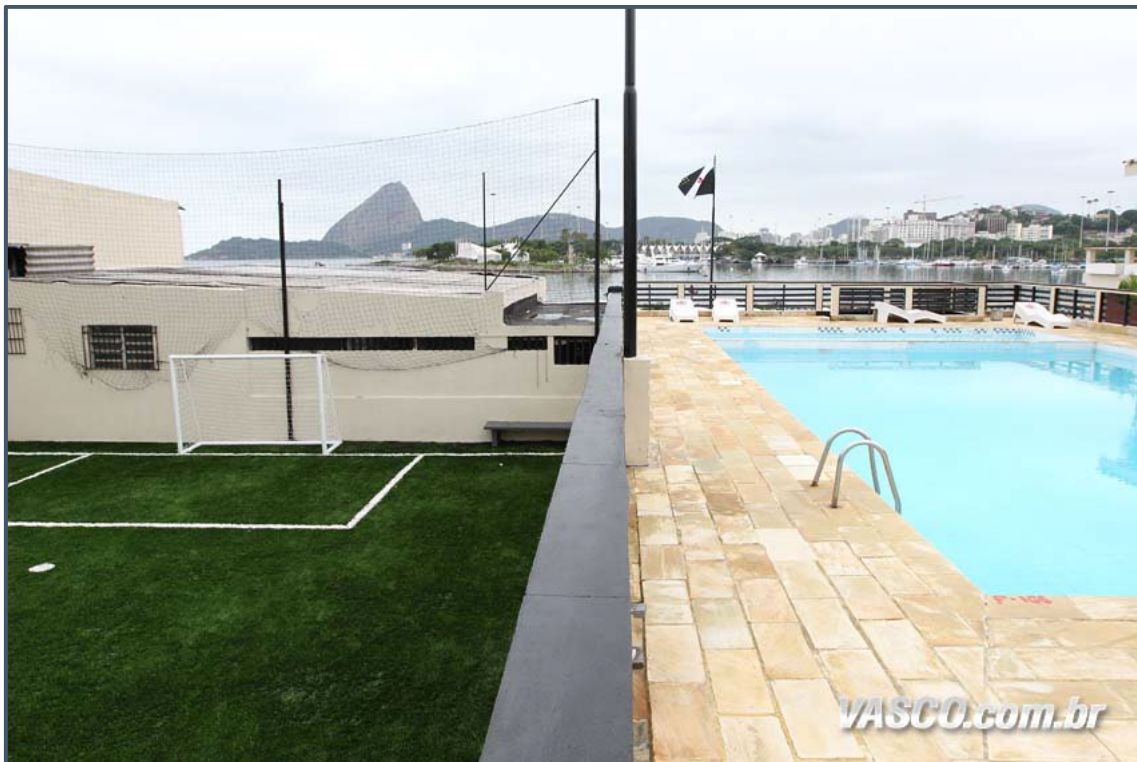
Sede do Calabouço

Av. Ataulfo de Paiva, nº 1165, 3º andar CEP 22440-034 | Rio de Janeiro, RJ