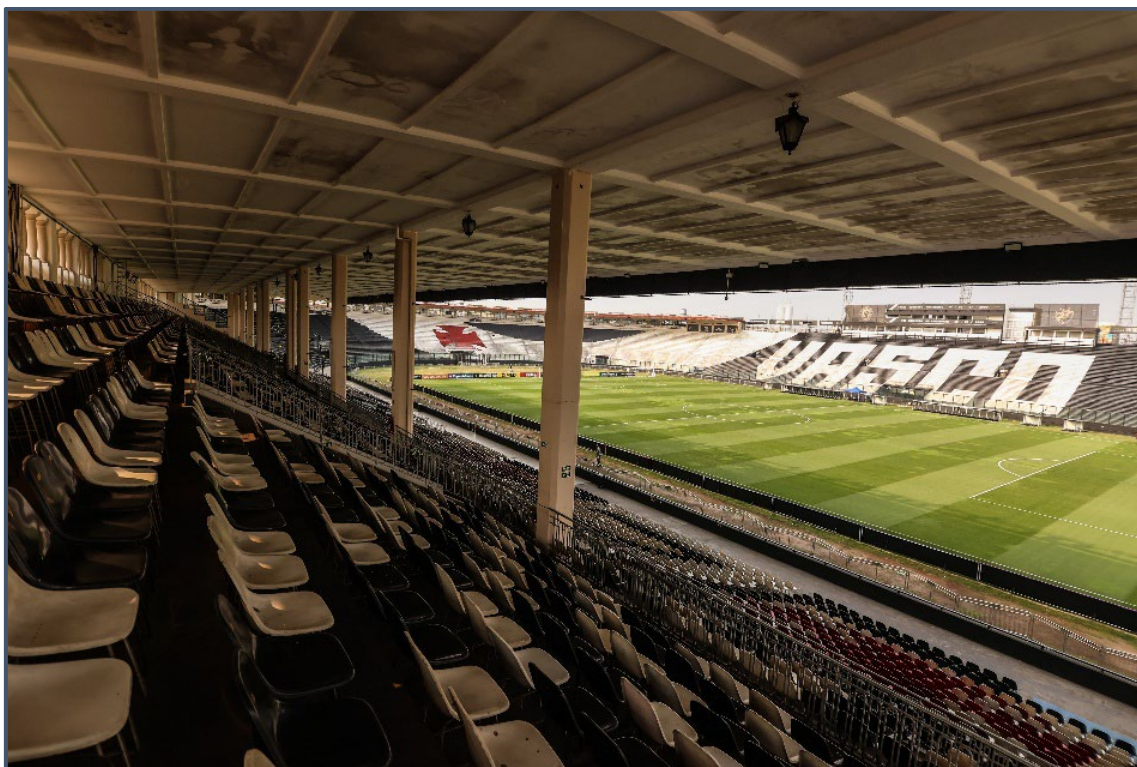
Estádio de São Januário