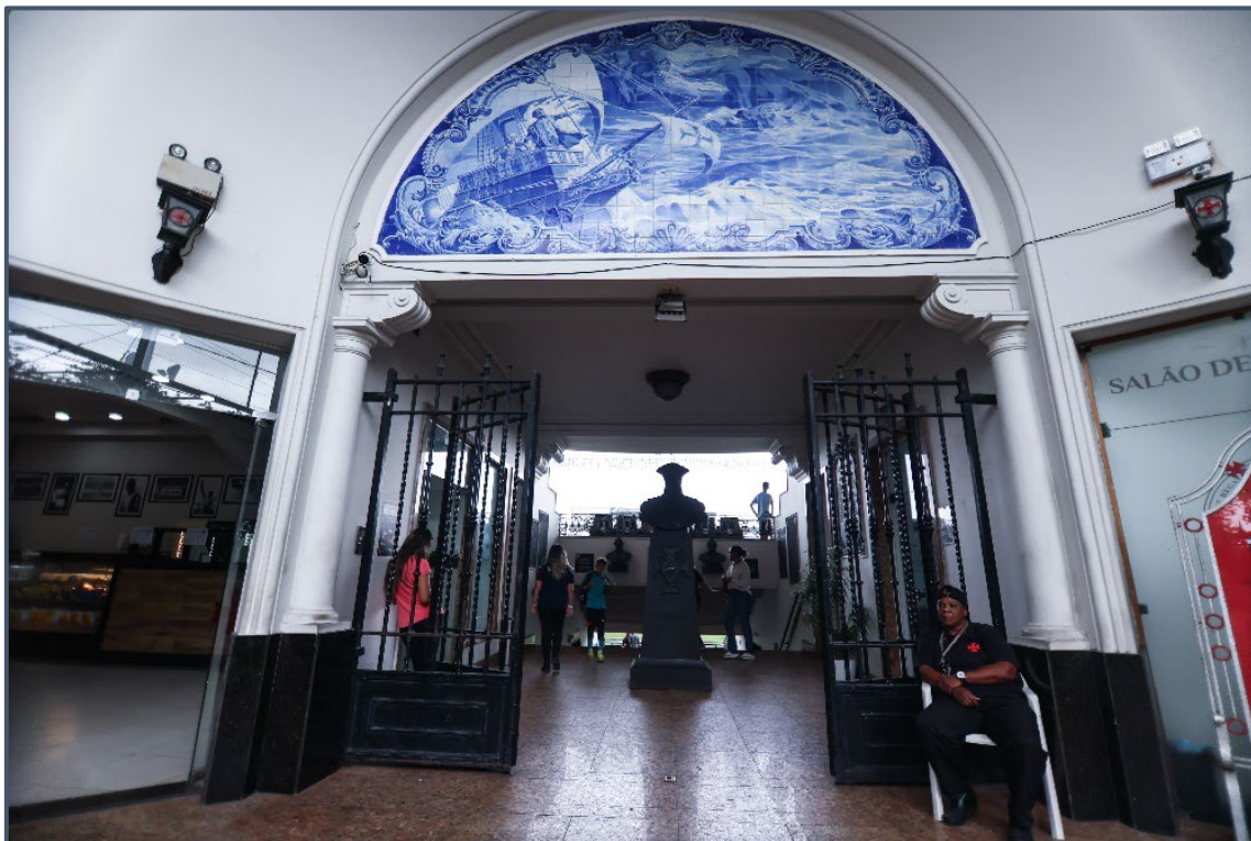
Estádio de São Januário